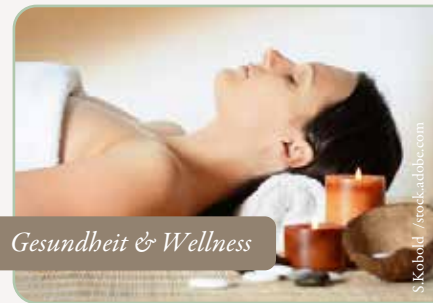
Gesundheit & Wellness