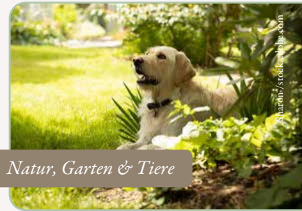
Natur, Garten & Tiere