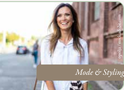
Mode & Styling