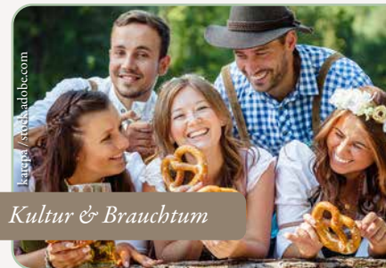
Kultur & Brauchtum