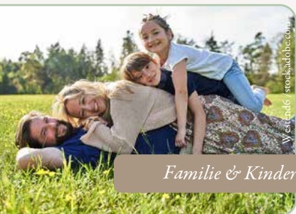
Familie & Kinder