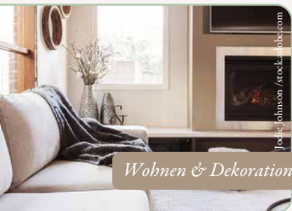
Wohnen & Dekoration