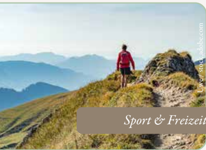
Sport & Freizeit