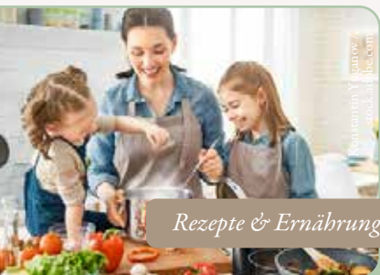
Rezepte & Ernährung