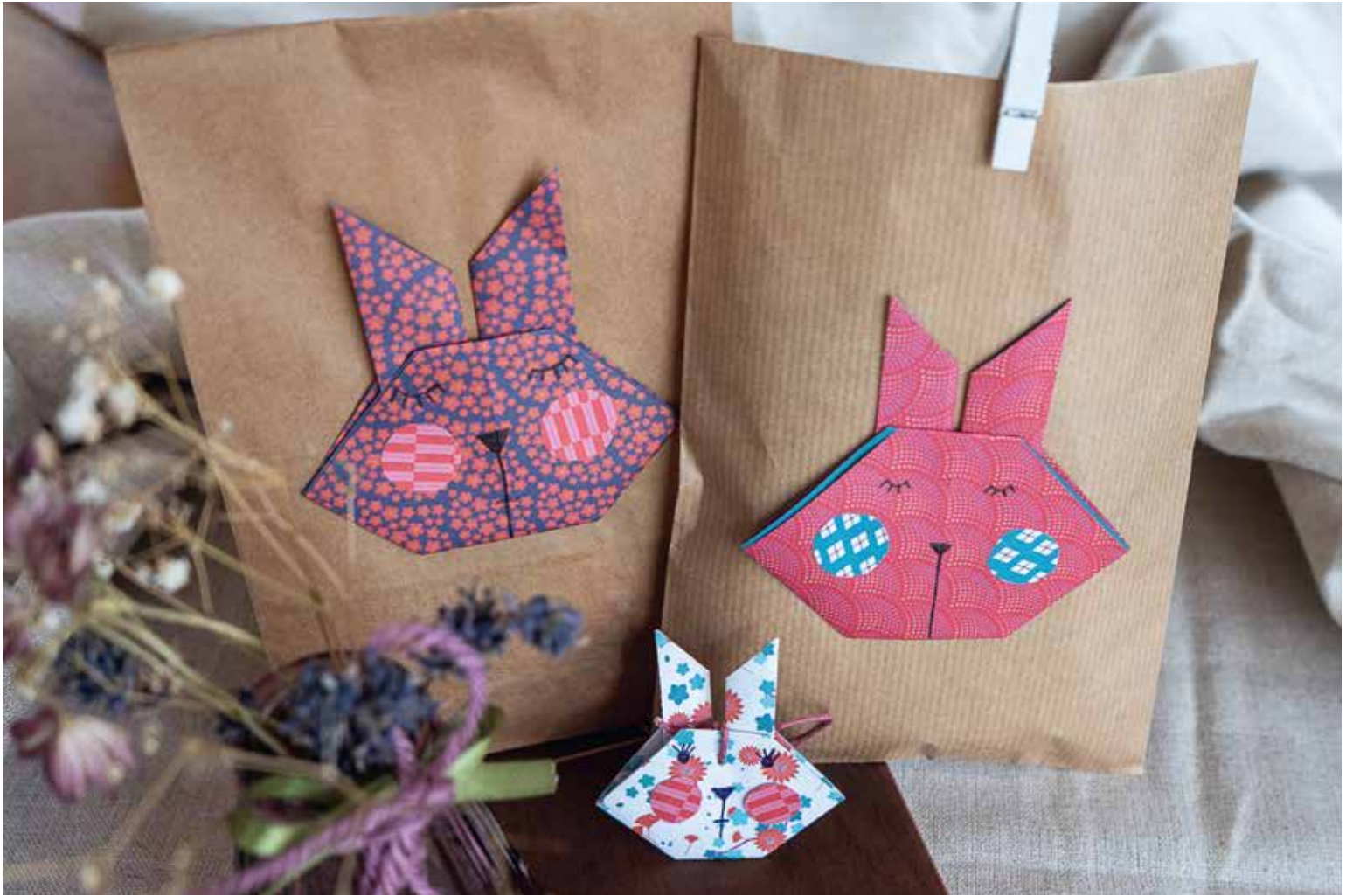
Ideen, Text, Anleitung & Fotos: Camilla Frei & S