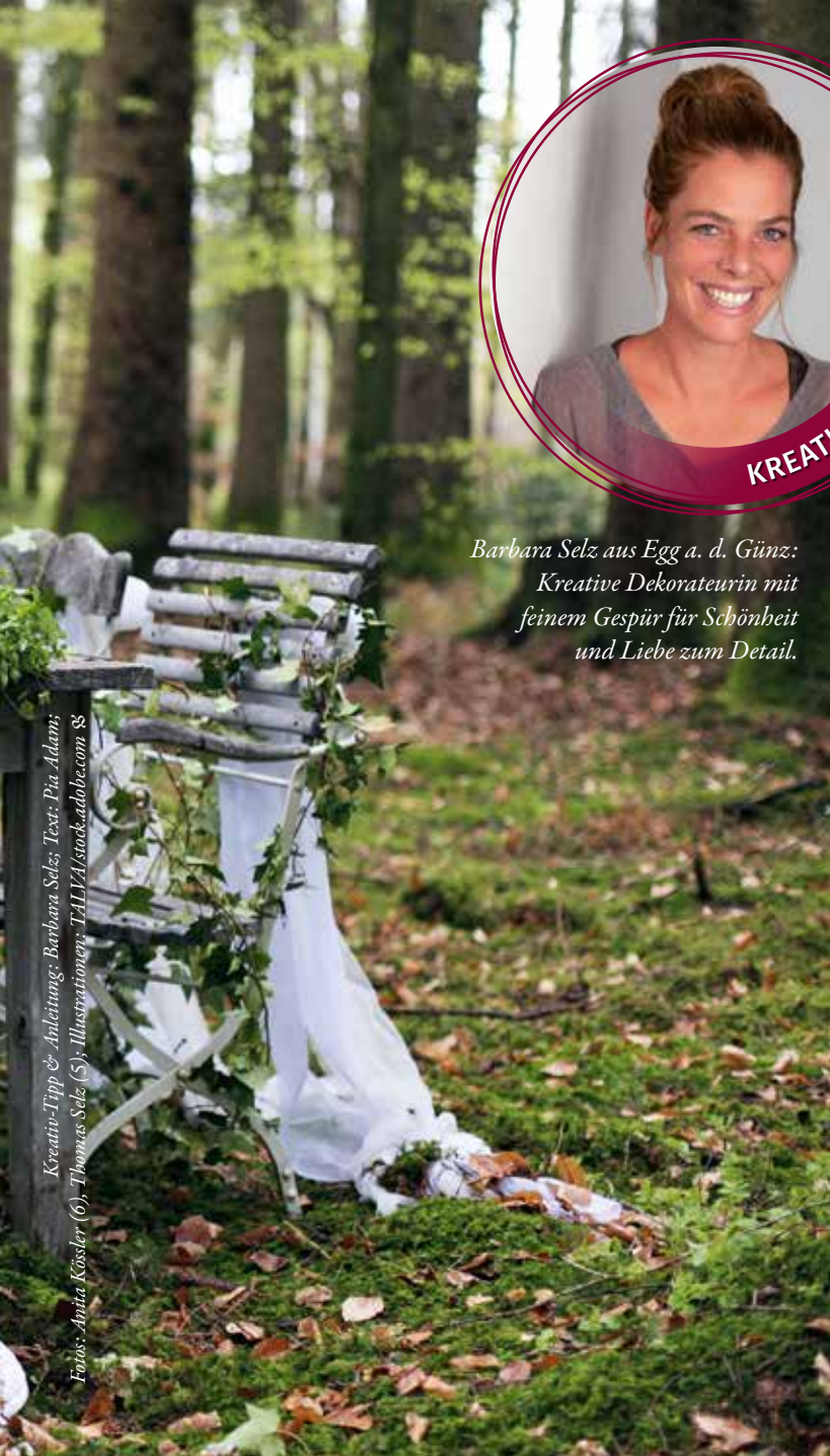
Kreativ-Tipp & Anleitung: Barbara Selz; Text: Pia Adams Illustrationen: TillyAStock.adobe.com &