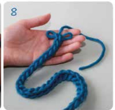
8 Die Strickschnur von der Strickgabel nehmen.