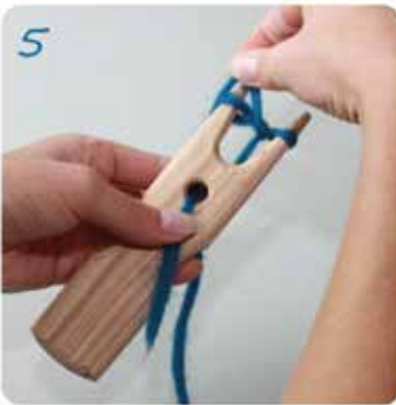
5 Diesen Vorgang links und rechts wiederholen.