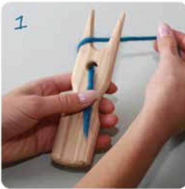
1 Die Wolle von vorne nach hinten durch das Loch der Strickgabel ziehen und mit dem Daumen festhalten.