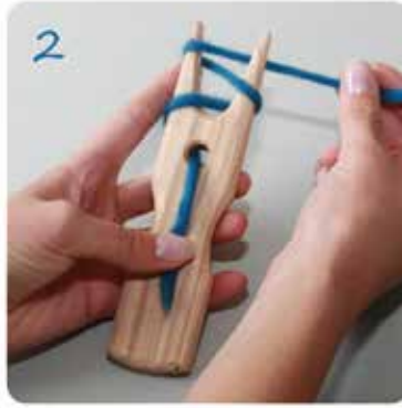
2 Jetzt die Wolle in Form einer Acht um die Zinken legen.