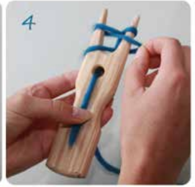
4 Nun die unten liegenden Schlingen mit den Fingern über die darüber liegenden Schlingen von außen nach innen heben.