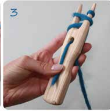
3 Die Wolle hinten mit der linken Hand halten.