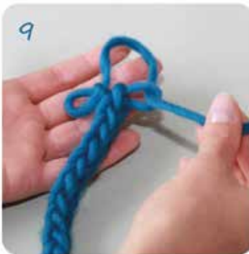
9 Den Schlussfaden durch die beiden Schlingen ziehen...