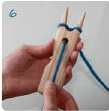
6 Den Anfangsfaden festziehen.