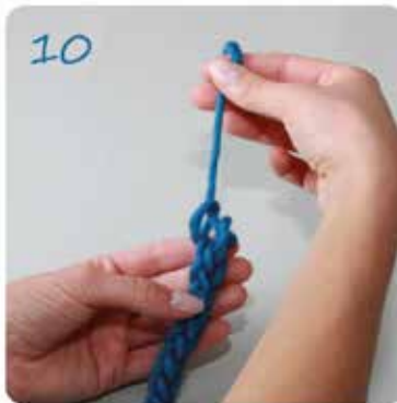
10 ... festziehen. Den Anfangs- und Schlussfaden vernähen.