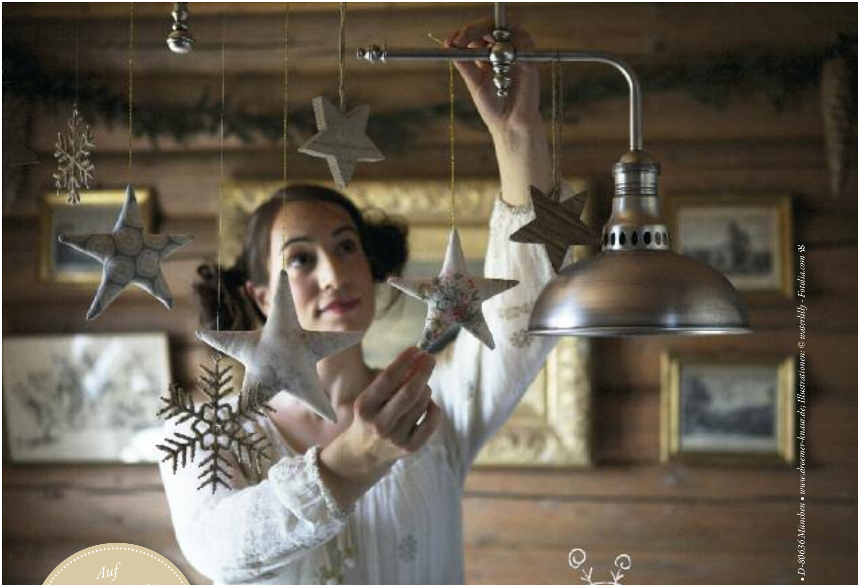
• D-80636 München • www.droemer-knaur.de 88

Auf unserer Webseite www.dieallgaeuerin.de finden Sie die Anleitungen.