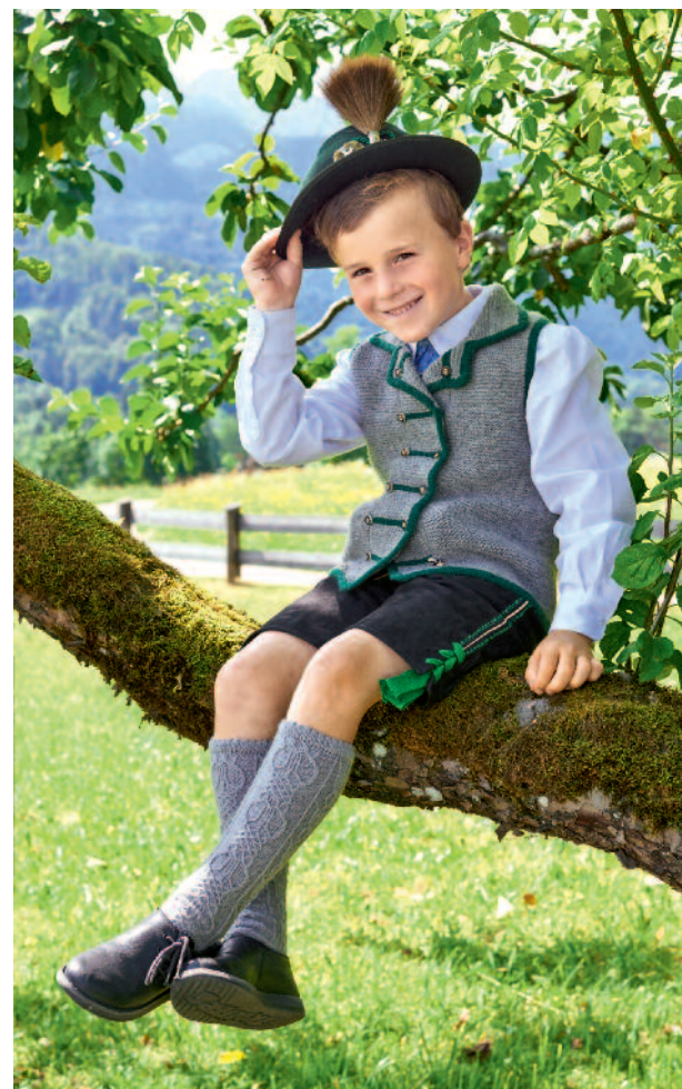
Mit dem Papa wandern gehen und anschließend auf die Festwoche. Spitze! Da zieh' ich meine Trachtenweste an!

Linkes Vorderteil: 54 (56) M in Grau meliert anschlagen. In folg. Einteilung str., dabei mit 1 Rück-R beginnen: Rand-M, 13 M kraus re, 1 M als Begrenzung der Verschlussblende bis zum Halsausschnitt als Halbpatent-M arb., 38 (40) M kraus re, Rand-M. Für den 1. Riegel nach der 21. R ab Anschlag über 14 M ab li Rand 4 R in Flaschengrün in Intarsientechnik str., die folgenden 4 Riegel nach je 22 (24) grau melierten R einstr., den 6. Riegel im Revers erst nach 31 grau melierten R einstr. und dabei in 1 Rück-R beginnen, damit hinterher beim Umschlagen des Revers die »rechte« Seite außen liegt. Fürs 1.