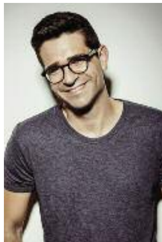
Der Fotograf Marcel A. Mayer aus Österreich fotografierte das Model des Monats August.