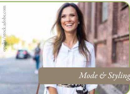
Mode & Styling