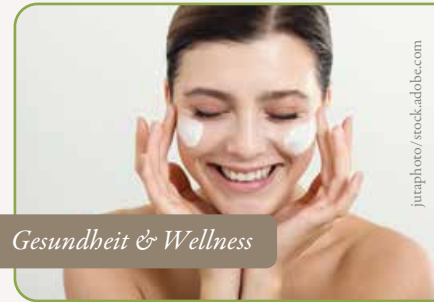
Gesundheit & Wellness