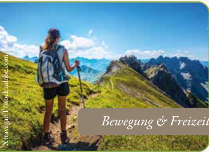
Bewegung & Freizeit