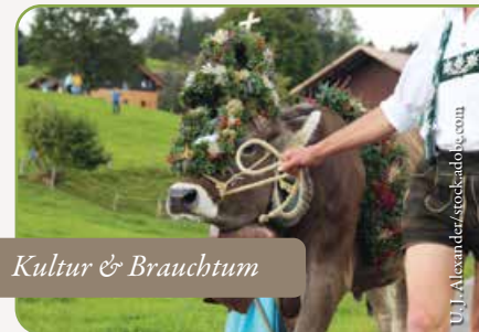
Kultur & Brauchtum