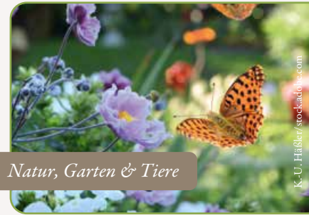
Natur, Garten & Tiere